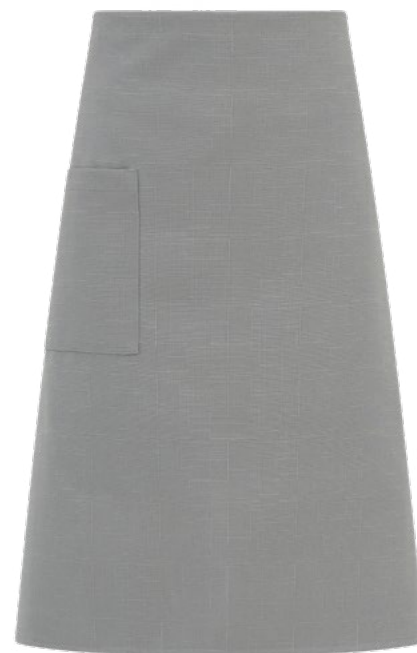
019 Grigio chiaro